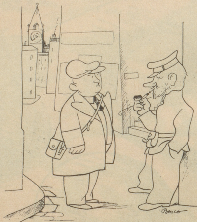
In der Großstadt Züri

Willi: «Jo, aber da heft desäb Kantonschemiker em Land dänn schwer gschadet, wo d'Schnapsfälschig us-gschwätzt het!» Bo.