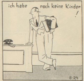
(Copyright, 1937, by The Bell Syndicate, Inc.)