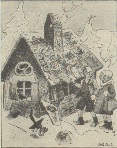
Hänsel und Gretel am Knusperhäuschen «Hast du auch deine Nährmittelskarte bei dir?» Deutscher Humor aus dem «Simplicissimus»