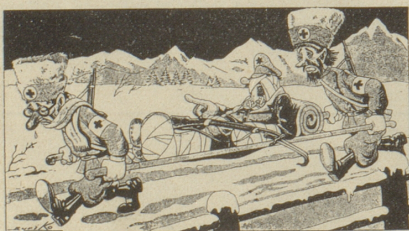
Der Bolschewismus im Vormarsch: «So, und jetzt wollen wir den Süden erobern!» Italienische Satire aus «420, Florenz»