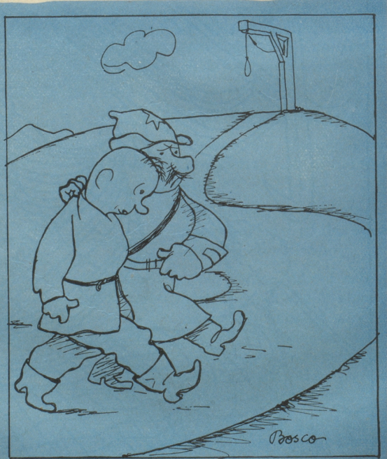
Der Baumeister dieses Hauses wird verhaftet.