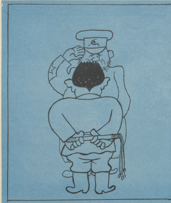
Stalin: „Warum gehts in Finnland nicht vorwärts?“ Oberst: „Es ist zu kalt, Väterchen — 40 Grad!“