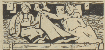
„Du chasch e Decki vo mir ha, ich ha warm gnueg i mym Schlafspätz.“ „So eine wott i dän au!“ „Da bruchsch nu a de Spätz z'schrybe.“