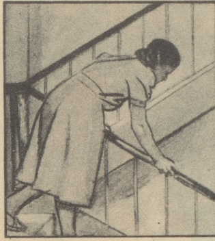
„Ist denn Ihrer auch noch nicht daheim? Bei dem schlechten Wetter holen sie sich gleich den Husten!“