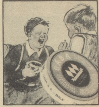
„Keine Angst, ich gebe dem Buben immer Gaba auf den Schulweg mit. Gaba schützt vor Husten und Heiserkeit.“