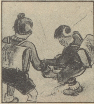
es wird oft eine Stunde daraus. Man „schleift“ oder tappt in die Pfützen. Und wenn's gar Schnee gibt!