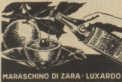
MARASCHINO DI ZARA · LUXARDO

Nach einigen Wochen. «Los Müetti, bschtell doch jetz eifach sälber es Brüe- derli, 's gaht guet, der Vater isch ja im Diensch.» Wihu