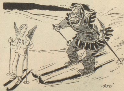
Wintersport. «Maiteli, mach Platz!»

Welche Tomaten sind nicht eßbar? Die Automaten. fis