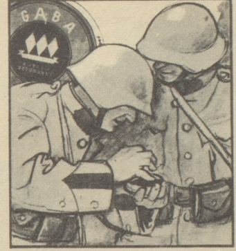
Peter: „... dann nimmt man ein- fach Gaba. Gaba schützt vor Hu- sten und macht die Stimme klar.“