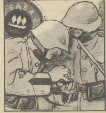
Peter: „... dann nimmt man ein- fach Gaba. Gaba schützt vor Hu- sten und macht die Stimme klar.“