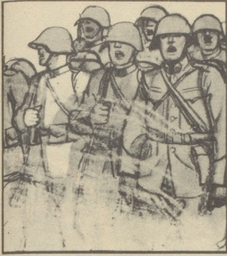
„Was tschumpelt im Kaput dahär Bi Sunneschy und Schnee? Das sind die Füsiliere Mit ihrem L. M. G.“