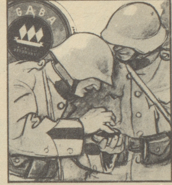
Peter: „... dann nimmt man ein- fach Gaba. Gaba schützt vor Hu- sten und macht die Stimme klar.“