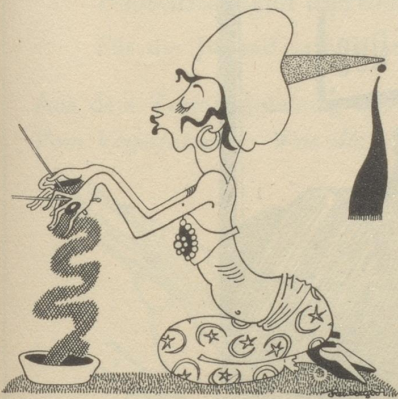
Die Fakisgattin lismet