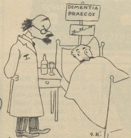
und sucht sich für die Ferien ein ruhiges Plätzchen aus