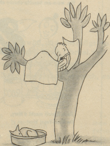
zieht das Vire Pericolosa- manie dem bequemen Hundeleben vor