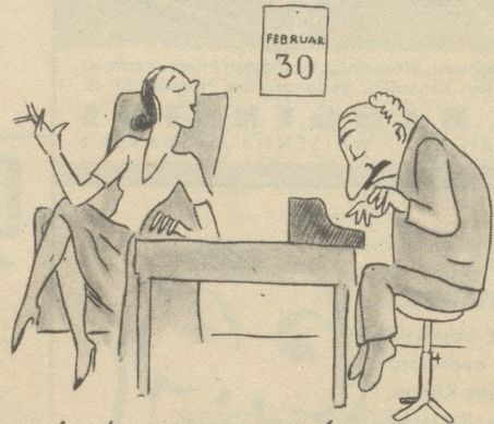
lässt sich seine Briefe durch seine Sekretärin diktieren.