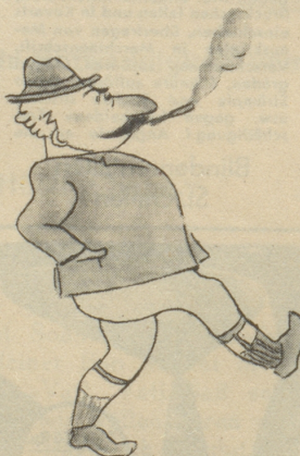
verzichtet sogar auf das Notwendigste