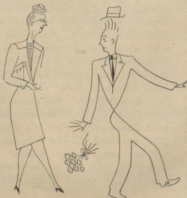
d'Verdunkligsbekanntschaft am Tag!

Neuzeitliche Wohnungen mit modernen Eheleuten wußten nichts mehr von der Existenz einer Bettflasche. Erstens fühlte man sich jung, man turnte, trieb allerlei Sport und produzierte so selber die nötige Wärme. Dann war schon das Wort «Bettflasche» irgendwie unästhetisch, und man hätte in normalen Zeiten deren Gebrauch empört abgewiesen. Doch man hatte gut lachen und großtun in diesen Tagen reinsten Schlaraffenlebens. Was kümmerte einem z. B. da der Wechsel der Jahreszeiten? Dank der Technik war man über die rauhesten Nordstürme erhaben. Man besaß ja seine gut funktionierende Zentralheizung, und, war man noch um einen Grad moderner,