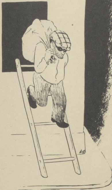
„Einer frage des andern Last.“