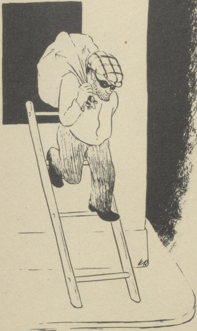
„Einer trage des andern Last.“