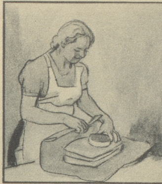
Gut, dass der Bund im Grossen gesorgt hat mit dem warmen Mantel und die Mutter im Kleinen sorgt: sie schickt ihm immer Gaba.