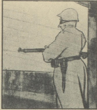
Es ist kein Schleck, denn da zieht's von allen Ecken. Man kriegt leicht „dr Bälli.“