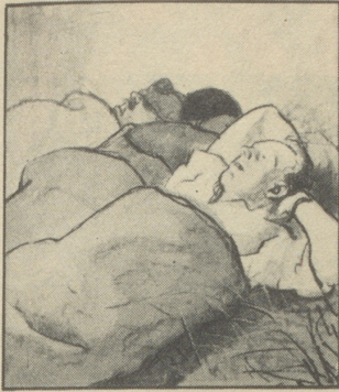
Das Aufstehen früh um 5 Uhr wird den älteren Soldaten nicht ganz leicht, die Glieder sind noch steif vom Pickeln und Schaufeln.