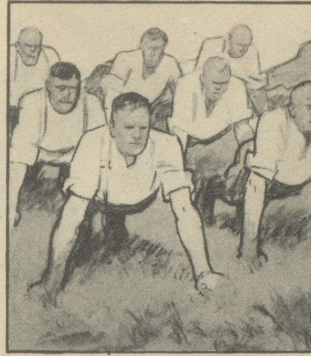
Aber auf's Morgenturnen freut sich die ganze Kompagnie; bei dem guten Kommando klappt es ausgezeichnet.