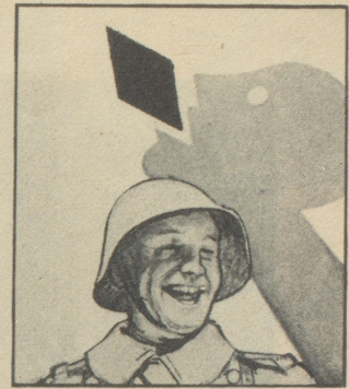
Er lässt sich halt immer Gaba von daheim schicken, denn er weiss: Gaba hält die Stimme klar.