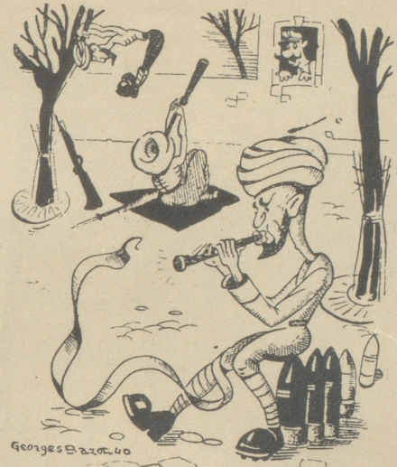
Die Macht der Gewohnheit!