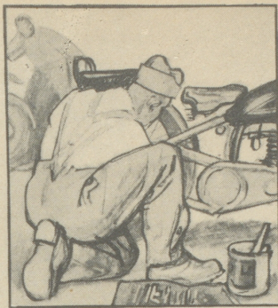
Aber der motorisierte Soldat findet's grad so lustig, wenn er seinen „Cöppel“ putzt, und überall schaut er nach, wo man tanken kann.