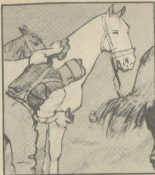
„Der Trainsoldat hat's lustig, Zwei Rösslein, die sind sein, Des Morgens in der Frühe, Es macht ihm keine Mühe, Putzt er sie blank und rein.“