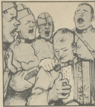
Nur das Singen geht nicht mehr so recht. Man kriegt einen Brumm-bass vom Motorfahren.