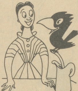
Der Roco-Vogel sagt ganz leise Frau, koch' ihm seine Lieblingsspeise.