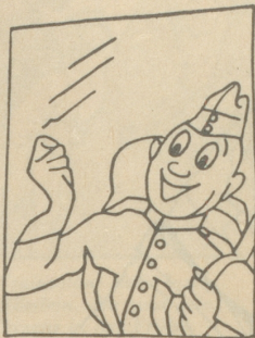
Der Fritz kommt hungrig wie ein Bär auf Urlaub eines Tags daher.