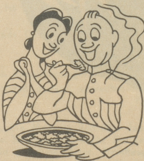
Man sieht die Frau, mitsamt dem Fritz bei „Roco Ravioli“ sitzen. Bei „Roco Ravioli“ sitzen. Dem Fritz, dem schmeckt es gar zu sehr, Er ass allein die Platte leer.