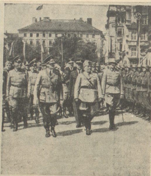
Hitler und Mussolini treffen sich in München.