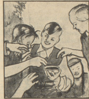
Aber keines holt sich den Husten, denn der kleine Fritz gibt allen von seinen Gaba. Gaba schützt vor Husten, Heiserkeit und Katarrh.