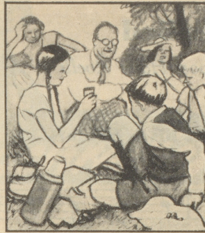
Jetzt sind auch die letzten Butterbrote aufgegessen, es wird sich leicht gehen mit den leeren Rucksäcken.