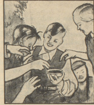
Aber keines holt sich den Husten, denn der kleine Fritz gibt allen von seinen Gaba. Gaba schützt vor Husten, Heiserkeit und Katarrh.