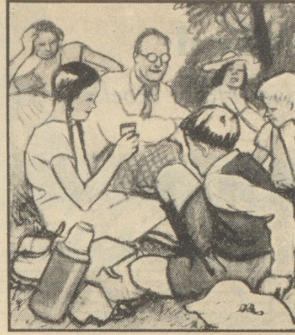
Jetzt sind auch die letzten Butterbrote aufgegessen, es wird sich leicht gehen mit den leeren Rucksäcken.