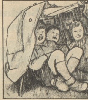
O weh, jetzt hat sie das Gewitter doch noch überrascht. Die besorgten Mütter zu Hause haben alle vor Erkältung gewarnt.