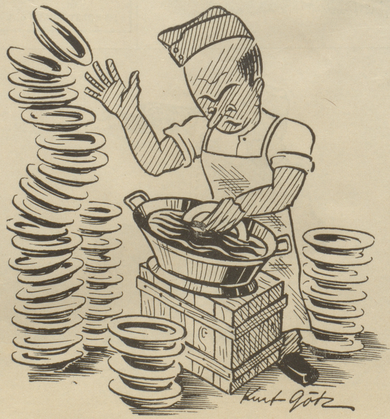
Werum au chlage, wämmes doch hät wie dihome?!

Grund: Landwirtschaftliche Arbeiten, nur noch eine Schwester zu Hause. Ich bin sonst gezwungen, das Vieh zu verkaufen. Führ. Z. A.