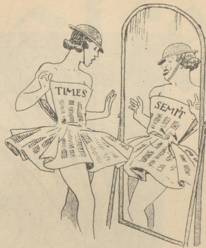
Der Berliner «Kladderadatsch» sieht die «Times» im Spiegel.

Kellner am Buffet: «Zwei Beefsteaks, eines davon weich!» Ohu