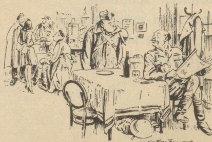
«Hat sie verstanden, daß ich Huhn-Schenkel will?»

Nach dieser Rede versank das Maultier in Trübsinn und ist seither trübsinnig geblieben. Peter Kilian