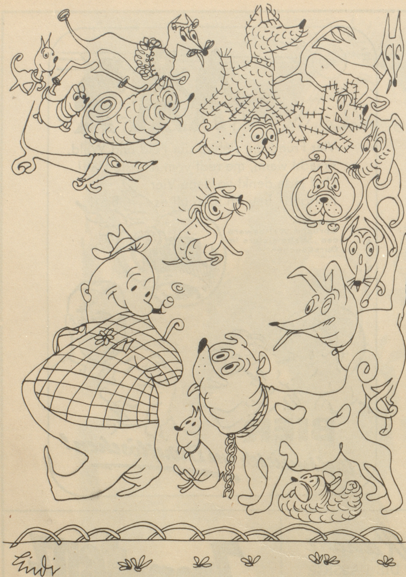
Der Herr, dem das Fifi gehört