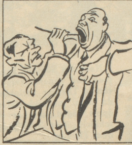
und die Blauband, besänftigt sie