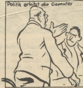
Politik erhitzt die Gemüter ...