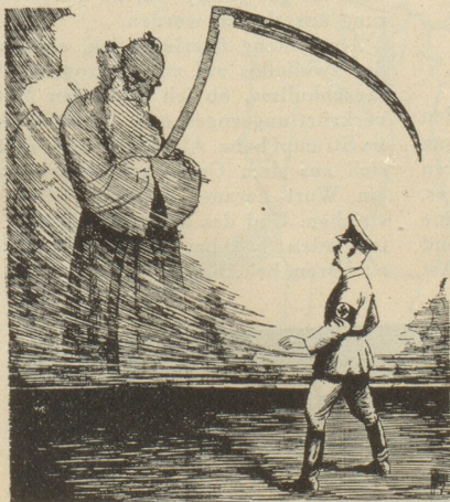
Vater Zeit: «Ich habe meine Offensive noch nicht begonnen.»

«Völker werden nie entehrt, wenn sie sich selbst treu bleiben.»