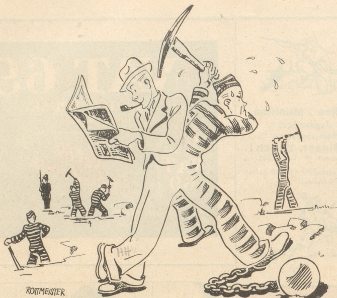
Einer der siamesischen Zwillingsbrüder wurde zu Zwangsarbeit verurteilt!