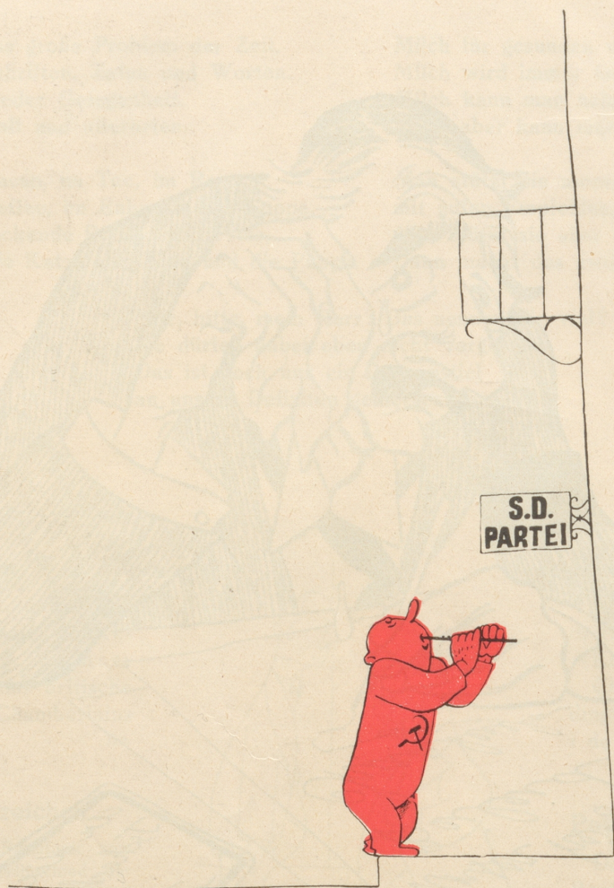
Die Kommunisten werben ebenso eifrig als erfolglos um die Vereinigung mit der Sozialdemokratischen Partei.

Warm flötet er vor ihrem Haus, Kind, reich ein Leiterlein heraus, Bin nicht mehr Konkurrenz.