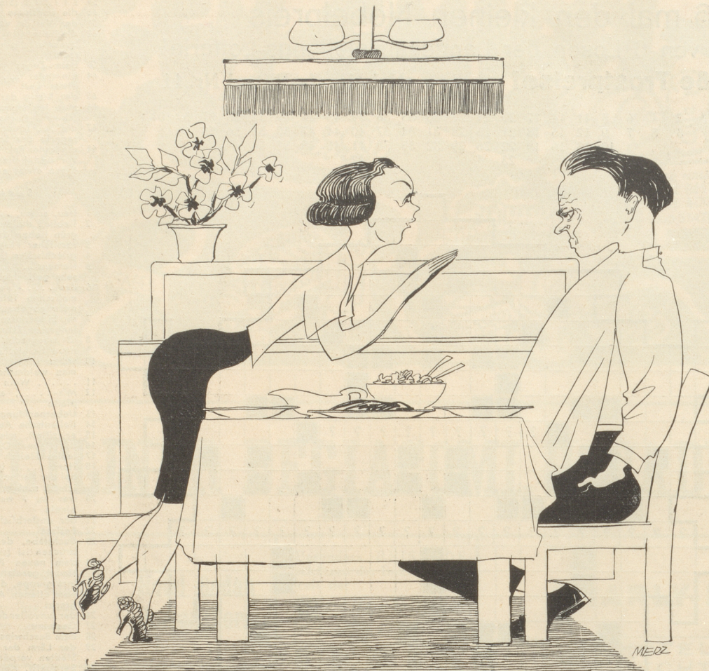
Das erste Mittagessen