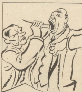
... und die Blauband, besänftigt sie