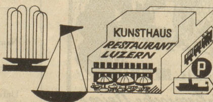
Inmitten der schönsten Parkplätze. Das «Buffet» der Automobilisten.

(... gestatten, Christine, daß ich mich vorstelle — aber öppe nöd wegem Almose, sondern wägem Teppich — Der Setzer.)