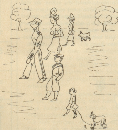
Unser Fliegerhauptmann führt am Sonntag seine Familie gestaffelt spazieren!

Ich erzähle meiner Kleinen, daß heute ein «großes Tier mit vielen Streifen» zu uns komme. Worauf sie meint: «Dänn isch es aber sicher es Zebra!» -ätti