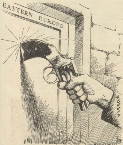
Ost-Europa und der «Neutrale»

Amerikanische Satire aus «The New York Times»