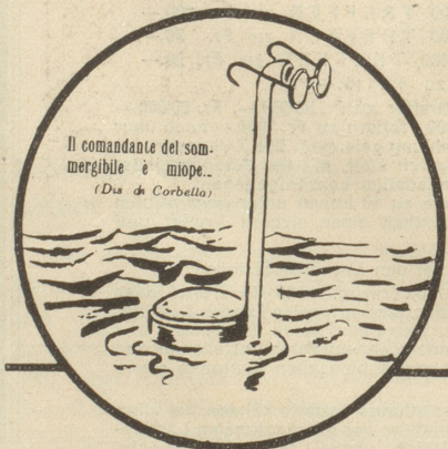
Der kurzsichtige U-Boot-Kommandant!

Amerikanische Satire aus «The New York Times»