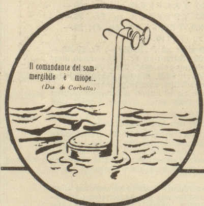
Der kurzsichtige U-Boot-Kommandant!

Amerikanische Satire aus «The New York Times»