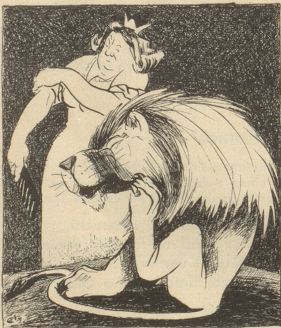
Schweden und die Spitzel Das Ungeziefer schädigt unser Ansehen, wir wollen den Schaden beheben! Schwedische Satire aus «Söndagsnisse Strix»

So mußt du streiten um jeden Gast mit dem guten Geld deiner Kassen. Und wenn du endlich einen hast, dann muß er die Schweiz verlassen.