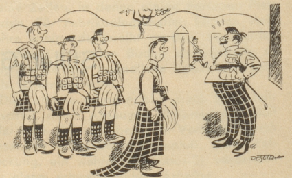
«Meine Verlobte sagte, daß der Rock mit der Schleppe besser passe.»

Dem skeptischen Schreiber ist in Betracht des Sinnes für Humor, den Herr Minger schon bei vielen Gelegenheiten gezeigt hat, auch in diesem Falle nichts passiert. Ney.