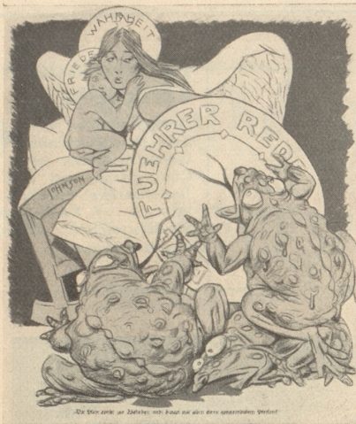
Deutsche Satire aus dem Kladderadatsch «Die Lüge reicht zur Wahrheit nicht hinan mit allen ihren giftgetränkten Pfeilen!»