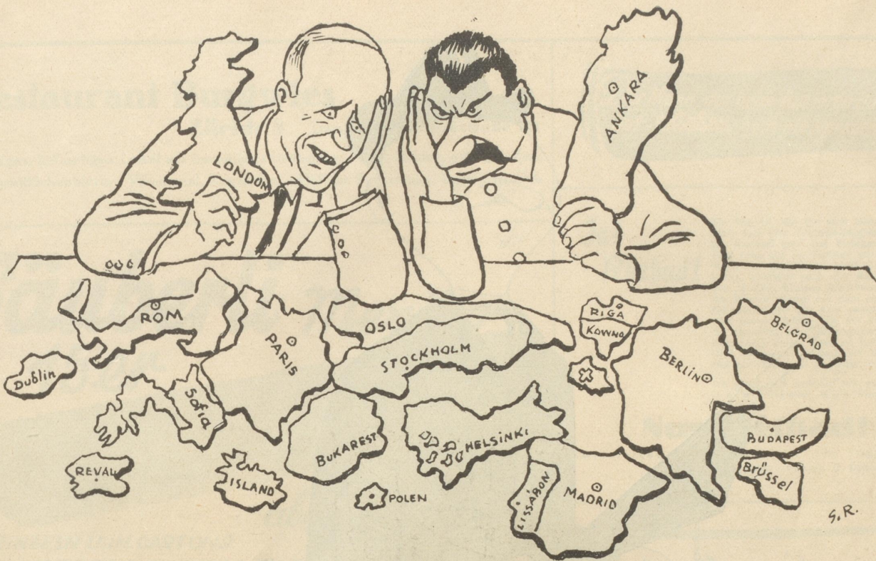
Kriegsnachrichten des Nebelspalfers: