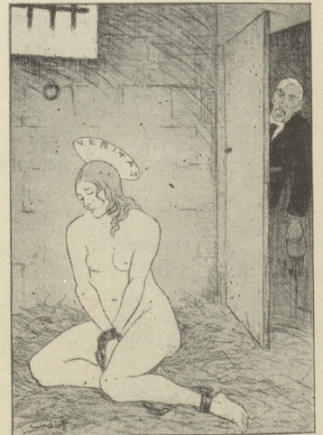
Deutsche Satire im Kladderadatsch: