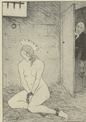
Deutsche Satire im Kladderadatsch: