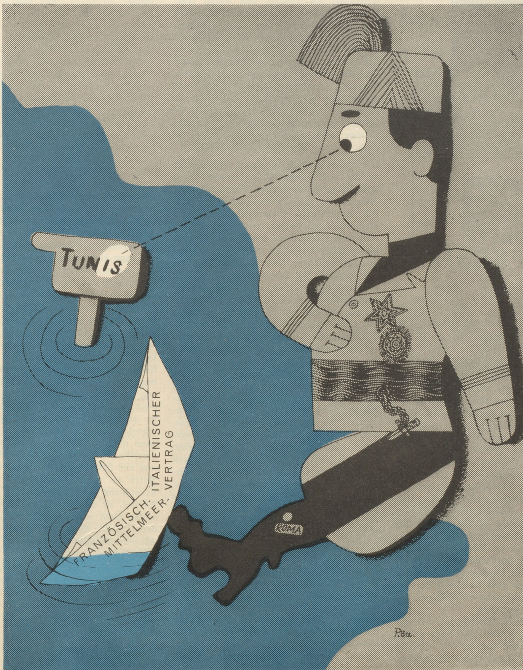
Geo-graphische Darstellung eines politischen Vorganges