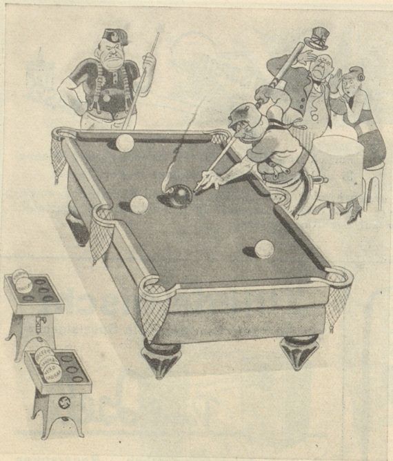
Um die Meisterschaft