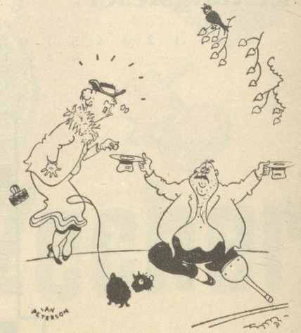
«Warum betteln Sie mit zwei Hüten?» «Das Geschäft geht so gut, daß ich eine Filiale eröffnen mußte!» (Ric et Rac, Paris)