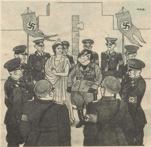
Italia (zu Mussolini): «Und du sprichst noch von Einkreisung?» (Marianne, Paris)