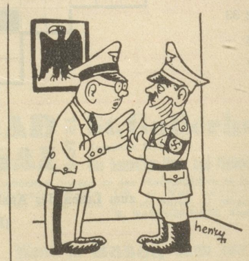
«Man spricht viel von den Briefen dieses King Hall!» «Dafür redet man nicht von den Couverts des Herrn Abetz!» (Canard, Paris)

Italienische Karikatur (Il 420, Florenz).