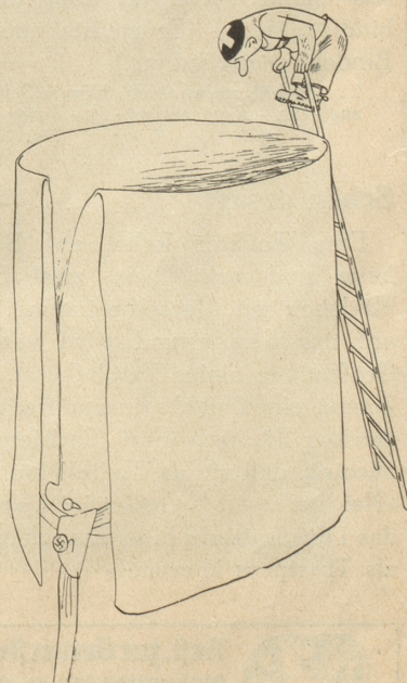
«Das isch also dā Schacht, wo mir scho so viel Gälid verlore händ!»