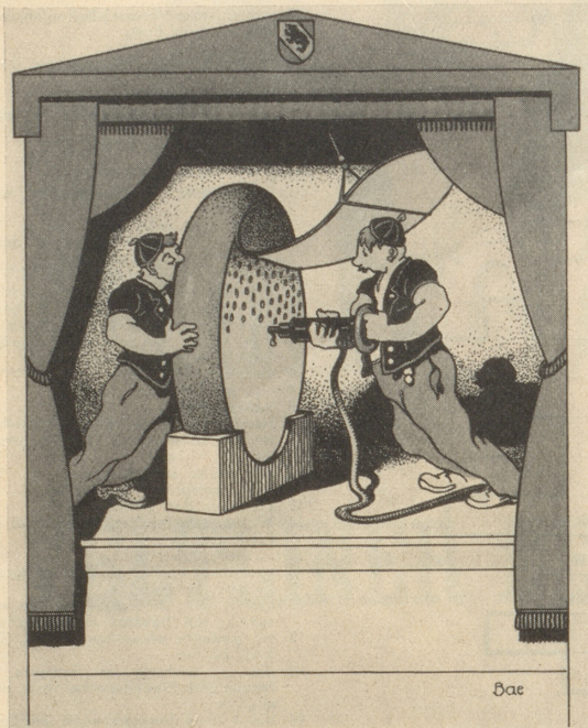
Wie me d'Löchli macht im Ämmitaler

„Was das Land oder die Kantone nicht vergessen dürfen, auszustellen.“