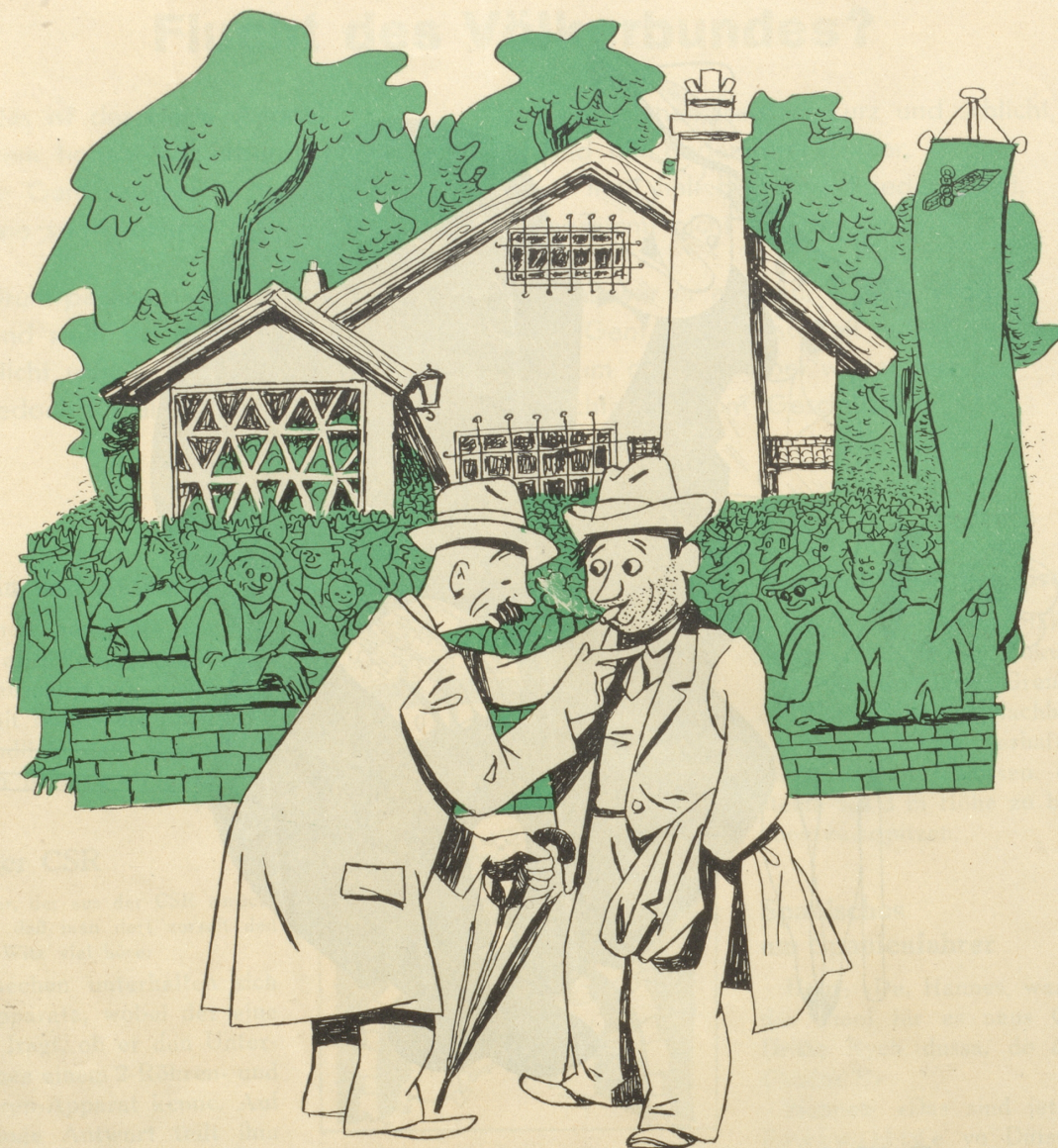
Die Zürcher Wirte klagen über flauen Geschäftsgang während der Landi.