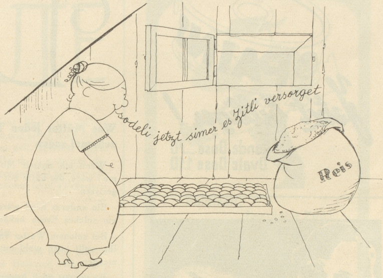
Eier und Reis sollte man zum Beispiel nicht im selben Raum aufbewahren — —