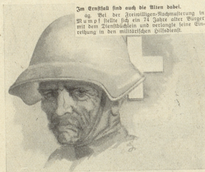
... hast noch der Söhne ja! Isler

Es ist furchtbar, wenn ein Redner immer wieder dasselbe sagt und es nicht weiß; schlimmer aber, wenn er es weiß. Rü.